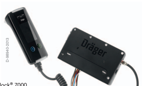
Dräger Interlock® 7000

Ved valg av startsperreren Interlock 7000 som styres av alkoholinnholdet i utåndet luft, har du fått et nøyaktig og pålitelig apparat. Slå på tenningen på bilen og foreta en pusteprobe. Dersom den målte alkoholkonsentrasjonen i pusteproven er under den innstilte grenseverdien, kan du starte motoren.